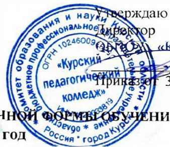
ГРАФИК УЧЕБНОГО ПРОЦЕССА II КУРСА ЗАОЧНОЙ ФОРМЫ ОБУЧЕНИЯ на 2022 – 2023 учебный год специальность 44.02.02 Преподавание в начальных классах

Сроки сессий: 10.10.2022 - 19.10.2022 06.02.2023- 15.02.2023 05.06.2023 - 14.06.2023