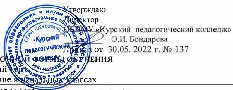
ГРАФИК УЧЕБНОГО ПРОЦЕССА III КУРСА ЗАДАНИЯ И ПОСРЕДСТВОМ ОБУЧЕНИЯ на 2022 – 2023 учебный специальность 44.02.02 Преподавание в начальных классах

Сроки сессий: 12.09.2022 - 23.09.2022 16.01.2023 - 27.01.2023 15.05.2023- 27.05.2023